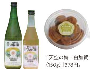
「天空の梅/白加賀 (150g)」378円。

梅酒や梅干し、冷凍梅などを販売。 「吟醸仕込梅酒」1350円(左)。 「純米大吟醸仕込梅酒」1750円(右)。