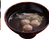
定食につけられる 「つみれ汁」。

みそ味、お酢でいただく「なめろう」単品1100円。 つみれ汁ラissetで+473円。