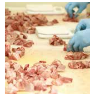
もつをていねいに串刺しに。橋村商店の加工施設。

町が運営する歴史と伝統ある食肉処理施設 あつあつのもつ鍋、カシラやハツなどバリエーション豊かなもつ焼き。古くから養豚業がさかんな横芝光町では、大正時代に日本人として初めて本格的なソーセージやハムの製造を始めた大木市蔵氏による「大木式ハム・ソーセージ」と並んで、新鮮なもつ料理が大人も子どもも大好きなソウルフードとして親しまれています。