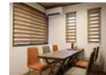
グループでゆっくりできる個室席も。