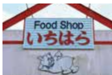
豚のマークが目印。