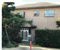
海まで歩いて5分。宿貸し切り、棟貸し切りも可能。

一年を通じて快適な気候の横芝光町は、スポーツ合宿の宿泊先としても根強い人気を誇る。民宿が天然芝のグラウンドや野球場を所有している宿もあるので、時間を気にせずのびのびとプレーに打ち込むことができる。