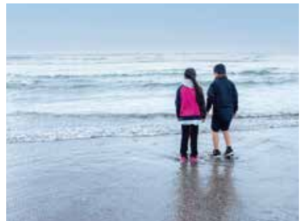
ウミガメにとって安心できる海を守る。