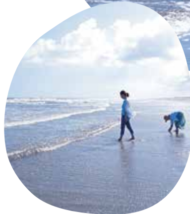
白砂が続く九十九里の海岸線。