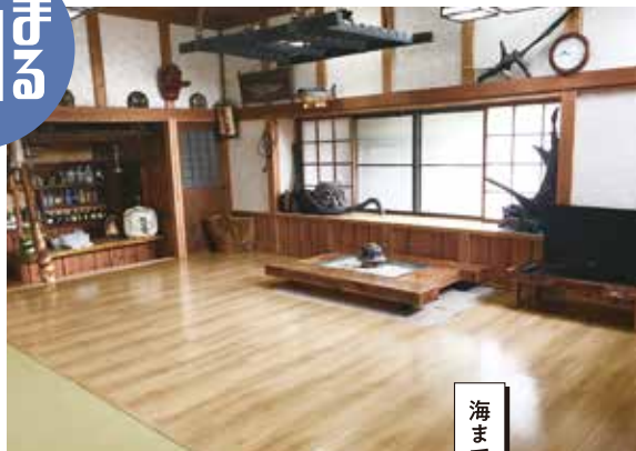
冬は囲炉裏で火をおこす、趣ある宿。