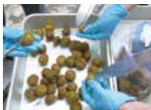
冷凍梅に切り込みを入れる。