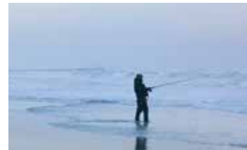
冬、早朝の海でサーフフィッシングを楽しむ人も。