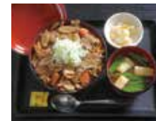
醤油ベースの甘辛味がおいしい 「滋養めし」800円。