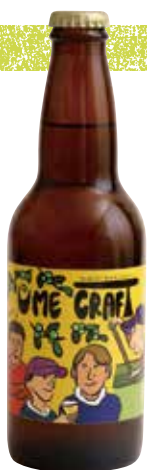
青い梅のクラフトビール 「UME CRAFT (330ml)」 660円。

香り高い梅をクラフトビールにして、その魅力をもっと広めたい。横芝光町宿泊組合が千葉市のクラフトビール醸造所「幕張ブルワリー」とコラボし、2023年に青い梅のクラフトビール「UME CRAFT」が誕生しました。