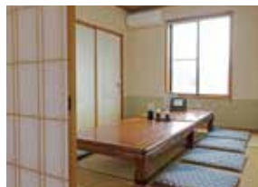
子連れ客に喜ばれる個室も。

千葉県山武郡横芝光町屋形5076-116 平日11:00~14:00、17:00~20:30 土日祝11:00~15:00、17:00~20:30 月は14:00閉店、火休(祝日は両日とも営業)