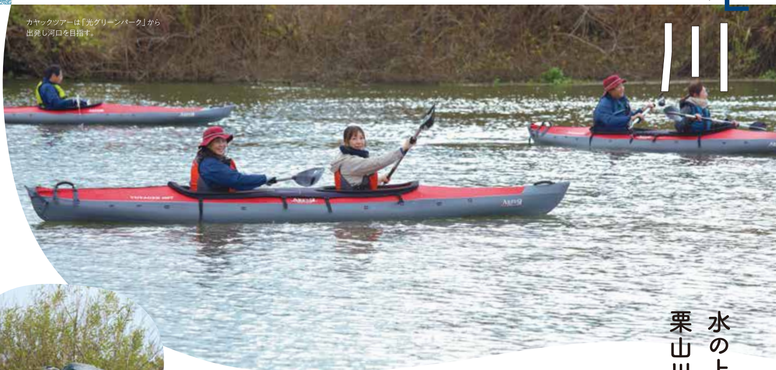
カヤックツアーは「光グリーンパーク」から出発し河口を目指す。