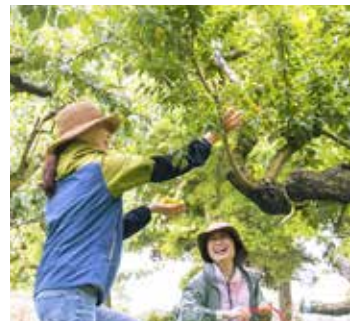
ひと粒づつ手摘みした梅の実は、いい香り。