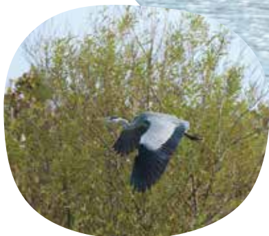
川辺には野鳥も飛来する。

「おいしい水は当たり前に得られるものではないことを、川遊びを体験しながら感じ取ってもらえたら」と、栗山