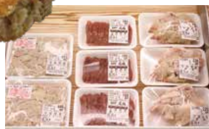
豚足、レバー、もつなど、元精肉店ならではの品揃え。