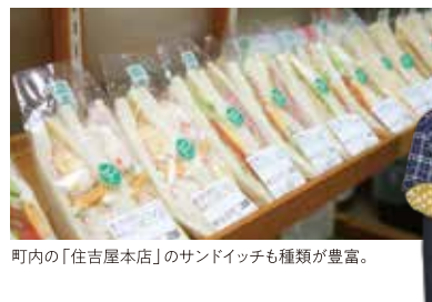
町内の「住吉屋本店」のサンドイッチも種類が豊富。