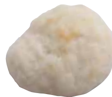
もちもち食感の「成型パン」 (3個入り)210円。