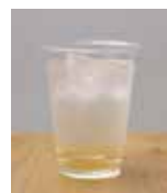
坂田城跡梅林で収穫した梅で作った濃厚な「梅ジュース」165円は館長の手作り。

千葉県山武郡横芝光町横芝1355-2 9:00~18:00 情報ラウンジ、待合所は8:00~20:00 ※季節により変更あり 無休(年末年始を除く)