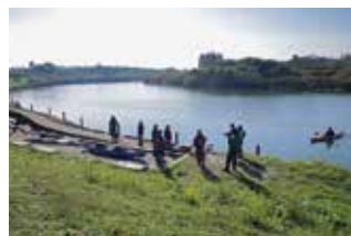
カヤックツアーは「光グリーンパーク」から出発。