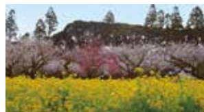
千葉県山武郡横芝光町坂田 2月中旬から3月上旬(梅の開花時期に合わせて開催)

梅の花の紅と白、菜の花の黄色が一度に咲きそろう「梅まつり」。梅農家の自家製梅干しや梅酒も販売する。