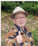
星のソムリエ®、SAMさん。星のイベントガイドや星空観賞推進のサポートを全国で展開する。