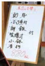
カニの出汁が濃厚!