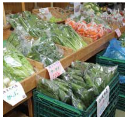
季節によってピーマンやオクラなどの詰め放題サービスも。