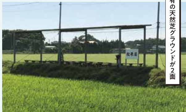
私有の天然芝グラウンドで心ゆくまでプレーを。