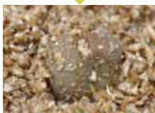
麦と合わせて熱を加える。