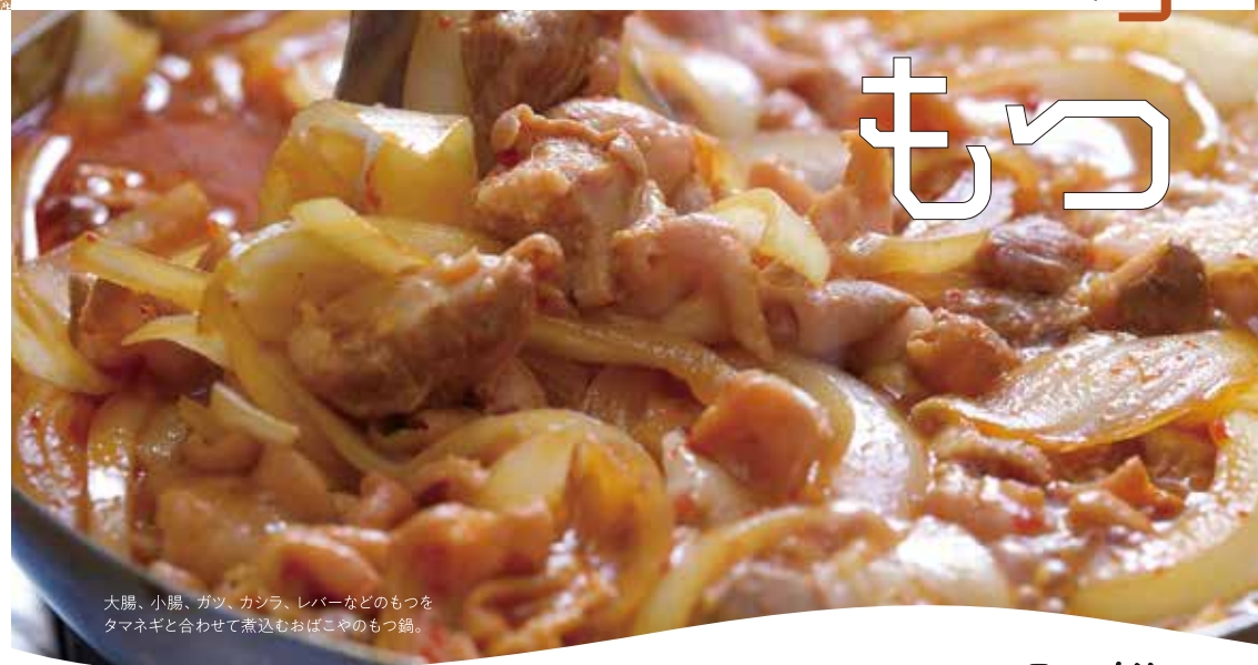
大腸、小腸、カツ、カシラ、レバーなどのもつをタマネギと合わせて煮込むおばこやのもつ鍋。