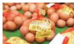
新鮮な卵もお土産として人気。