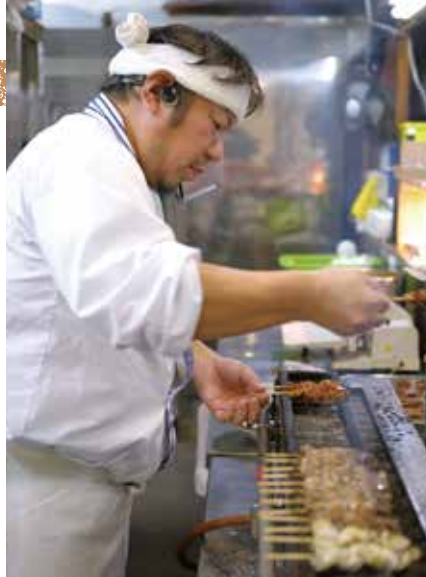
注文を受け、どんどん焼いていく。