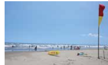
人混みが少ない、九十九里浜の穴場スポット。