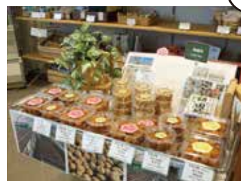
売店では町の特産品や飲み物などを販売。