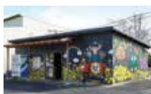
ほのぼのする外壁の絵は地元高校の美術部が描いてくれたもの。