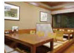
広〜い店内。掘りごたつ、座敷や個室もある。靴を脱いでリラックス。