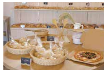
各種パン、とれたてフルーツを使ったタルトやロールケーキも販売。