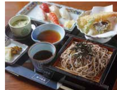
そばも刺身も天ぷらも食べたい！そんな人も大満足「あづま寿司セット」1498円。