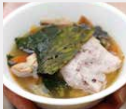
横芝光町ではお正月には、はばのりをたっぷり散らしたお雑煮をいただく。

日帰りもいけれど、1泊、2泊とステイすると、旅の彩りはもっと豊かに。泊まりのプランにすれば、夕暮れも星空も日の出も、時間を気にせずゆっくりと観賞することができます。