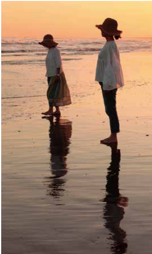
潮が引いたときに「水鏡」が見られる。

屋形海岸 / 千葉県山武郡横芝光町屋形地先字東雲 5356-1 木戸浜海岸 / 千葉県山武郡横芝光町木戸地先