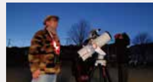
天体望遠鏡で土星や月を観察。

オリオン大星雲(M42)の位置を学び、多くの星たちと打ち寄せる波の音に「自分も星に住んでいるんだなあ」とぼんやりしていると、流れ星がすうっと横切っていました。