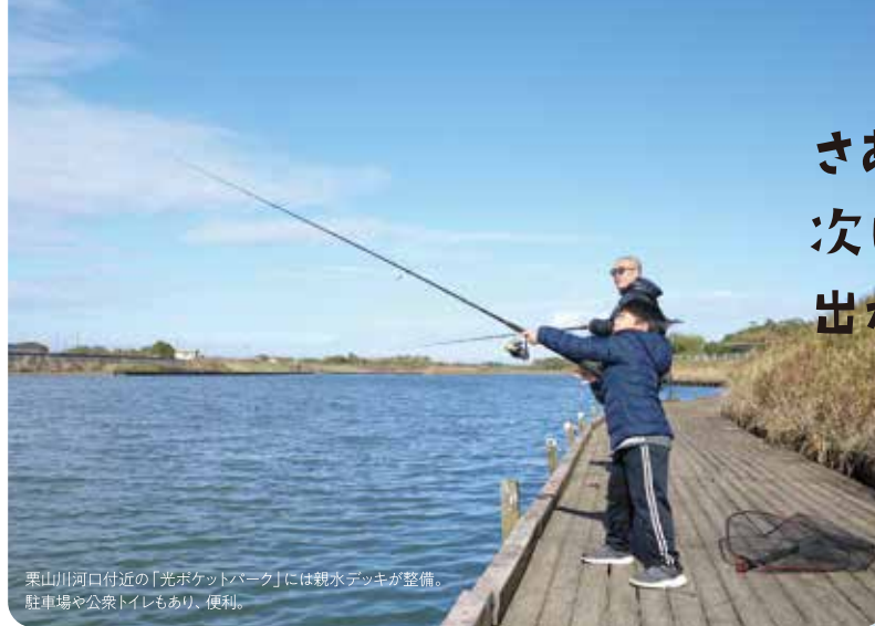
栗山川河口付近の「光ボケットパーク」には親水デッキが整備。駐車場や公衆トイレもあり、便利。