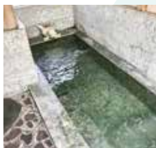
大浴場でゆっくり疲れをとろう。